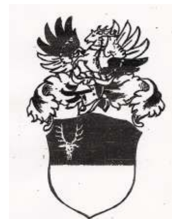
Wappen des Frank v. Geisslair